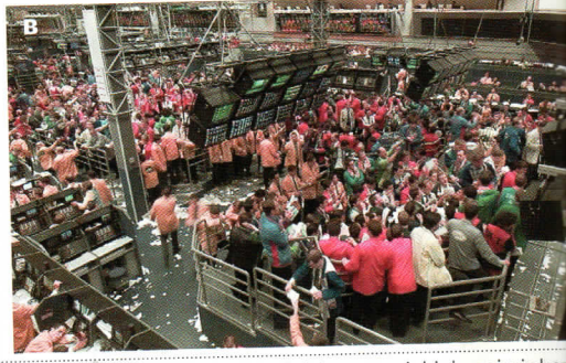
Najbardziej znaną giełdą na świecie jest giełda w Nowym Jorku (A). Spośród giełd europejskich największe znaczenie ma giełda w Londynie (B).